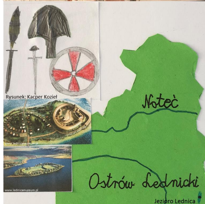
Rysunek: Kacper Kozieł