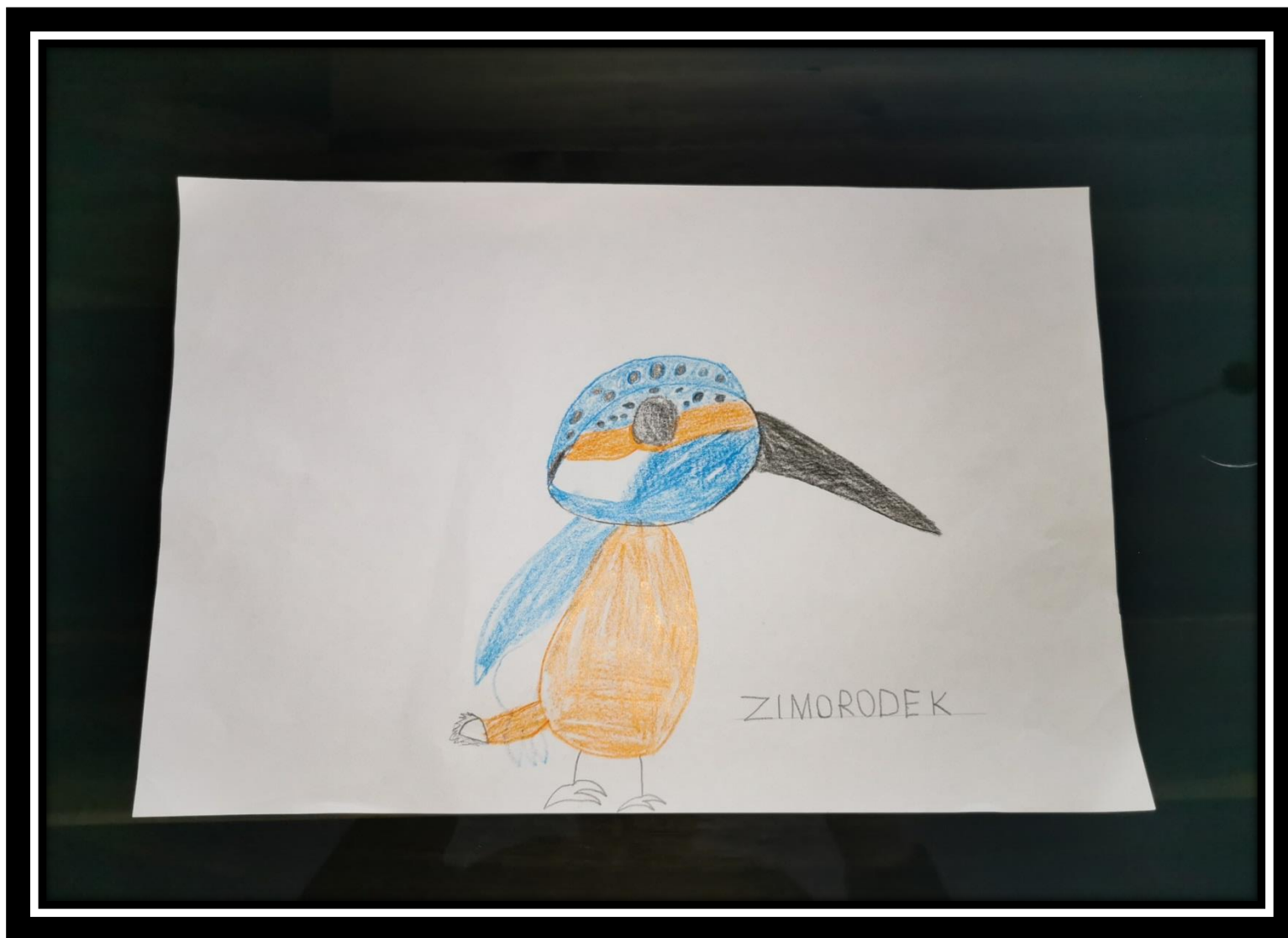
Powyżej rysunek Adama Senderowskiego