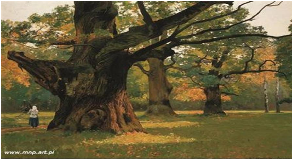
M. Wywiórski, Stare dęby w parku w Rogalinie, 1907.